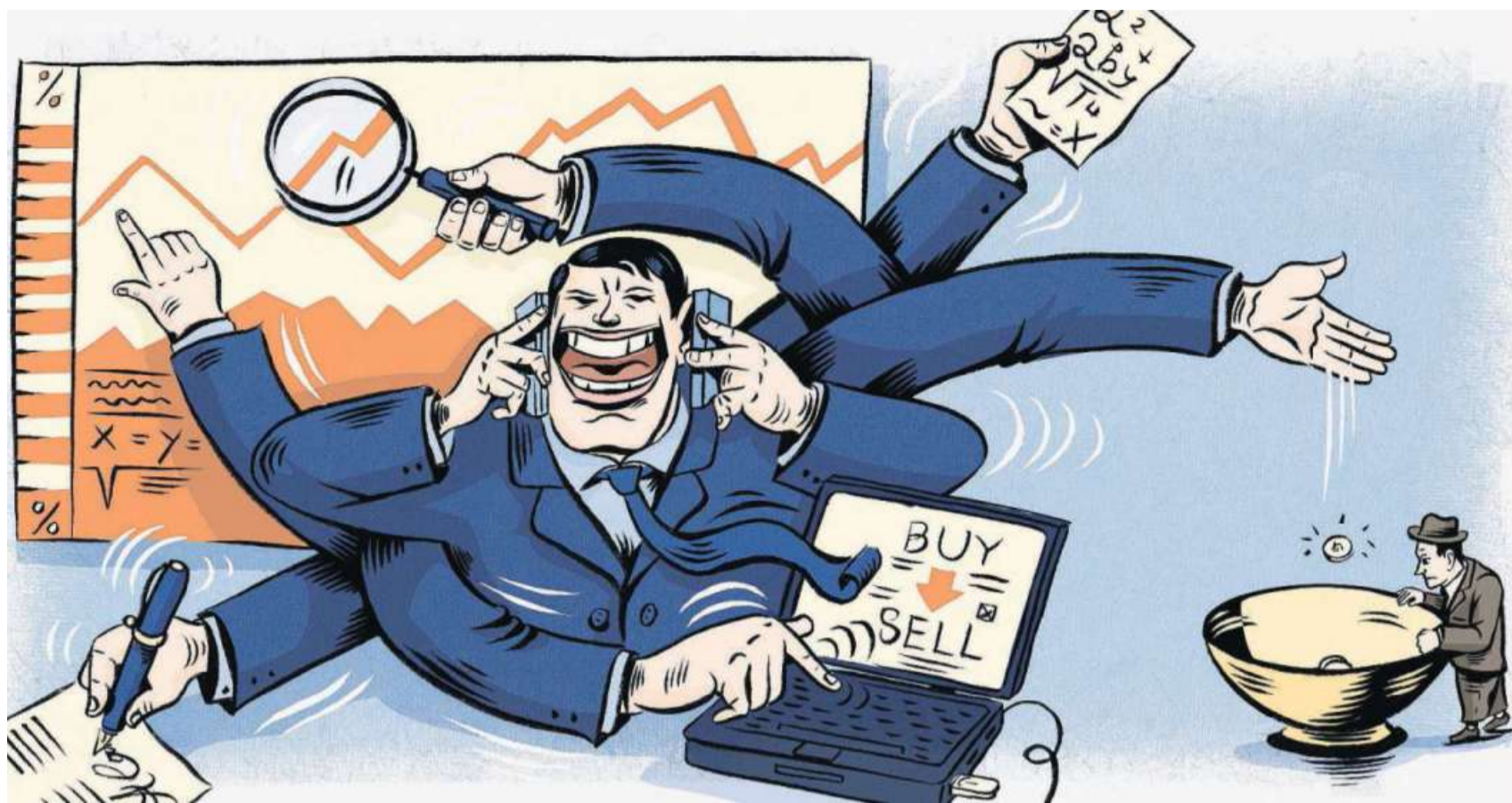
ILLUSTRATION: ANDREA CARREZ